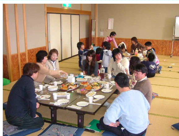
「手前が大人テーブル・奥が子供テーブル」

..*~*:. _.:*~*:. _.:*~*:. _.:*~*:. _.:*~*:. _.:*~*:. _.:*~*: