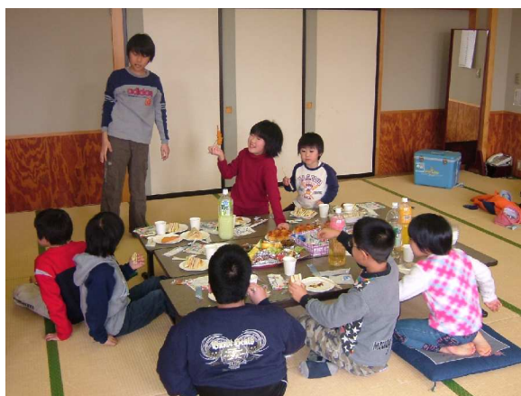
「子供たちの交流の様子」

子供たちは、総会の間もそれぞれグループを作り遊びました。紙飛行機、折り紙、お絵かき、ゲーム、押し花のしおり作りなどで楽しく過ごしました。ほとんどの子が小学生ということで、子供たちだけで仲良くできました。大きい子が小さい子を見てあげて、一緒に遊び、おやつを食べて過ごすうちに3時間が過ぎました。「また、遊ぼうね！」と言葉を交わすのを見ると、次の行事を楽しみにしているのがわかります。